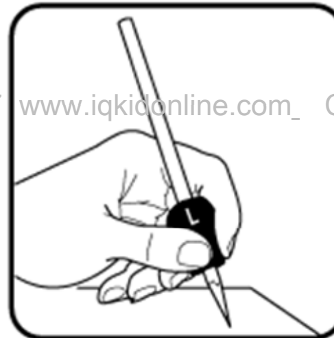
สำหรับผู้นัดซ้าย วางนิ้วโป้งบนด้านที่มีตัวอักษร " L " วางนิ้วชี้และนิ้วกลางบนร่องที่เหลือ