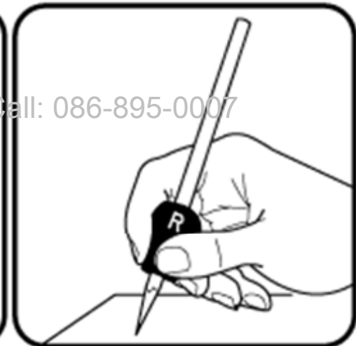
สำหรับผู้นัดขวา วางนิ้วโป้งบนด้านที่มีตัวอักษร " R " วางนิ้วชี้และนิ้วกลางบนร่องที่เหลือ