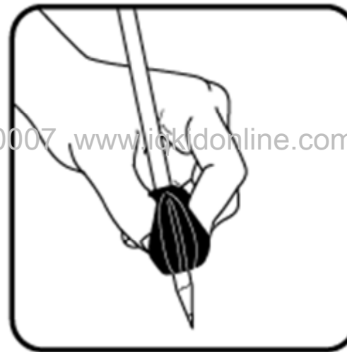
สำหรับผู้ถนัดซ้าย สอดนิ้วโป้งบนด้านที่มีตัวอักษร " L " สอดนิ้วชี้และนิ้วกลางบนร่องที่เหลื่อ