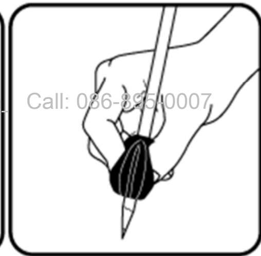
สำหรับผู้ถนัดขวา สอดนิ้วโป้งบนด้านที่มีตัวอักษร " R " สอดนิ้วชี้และนิ้วกลางบนร่องที่เหลื่อ